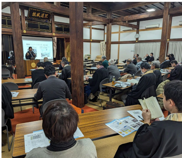
新潟教務所（三条別院）会場

去る2024年12月12日（木）新潟教務所と高田教務事務所において「是旃陀羅」問題教区説明会が実施されました。