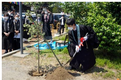
記念植樹式の様子