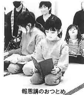
報恩講のおつとめ